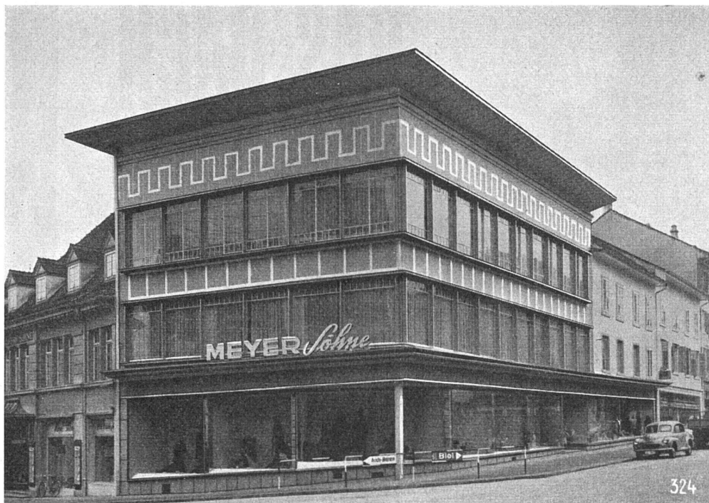
Geschäftshaus Meyer Söhne, Grenchen, 1950

Fassadenverklei- dungsplatten in 2 Far- ben, Brüstungs- und Sturzplatten mit ein- gestampften weißen Friesen