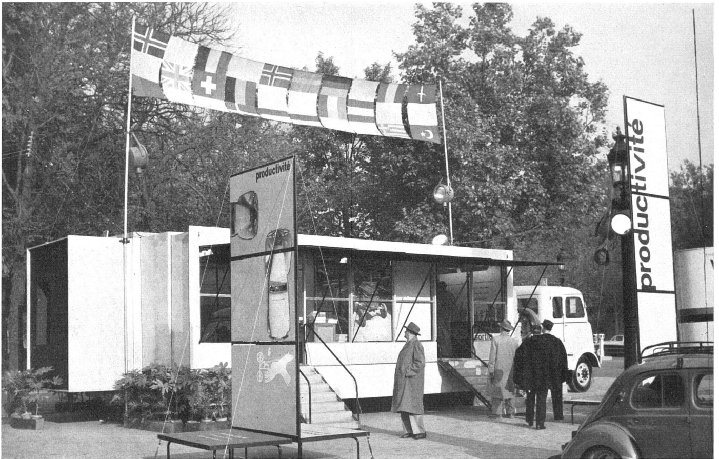
Der aufgeklappte Ausstellungscamion zum Besuche bereit. Farbe gelb, auch die Titeltafeln | Le camion-exposition ouvert aux visiteurs; tous éléments peints en jaune | The exhibition car ready to be visited, all elements painted yellow