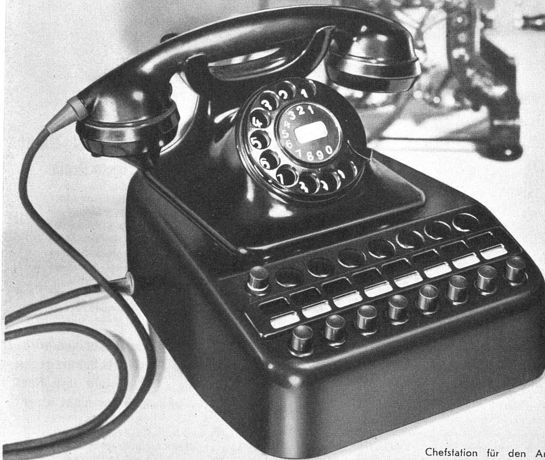
Chefstation für den Anschluss von 8 Amts- oder Hausleitungen

Der sinnreiche Aufbau unserer Telephon-Apparate ist das Ergebnis langjähriger Erfahrung. Albis-Stationen sind formschön, betriebssicher und angenehm zu bedienen.