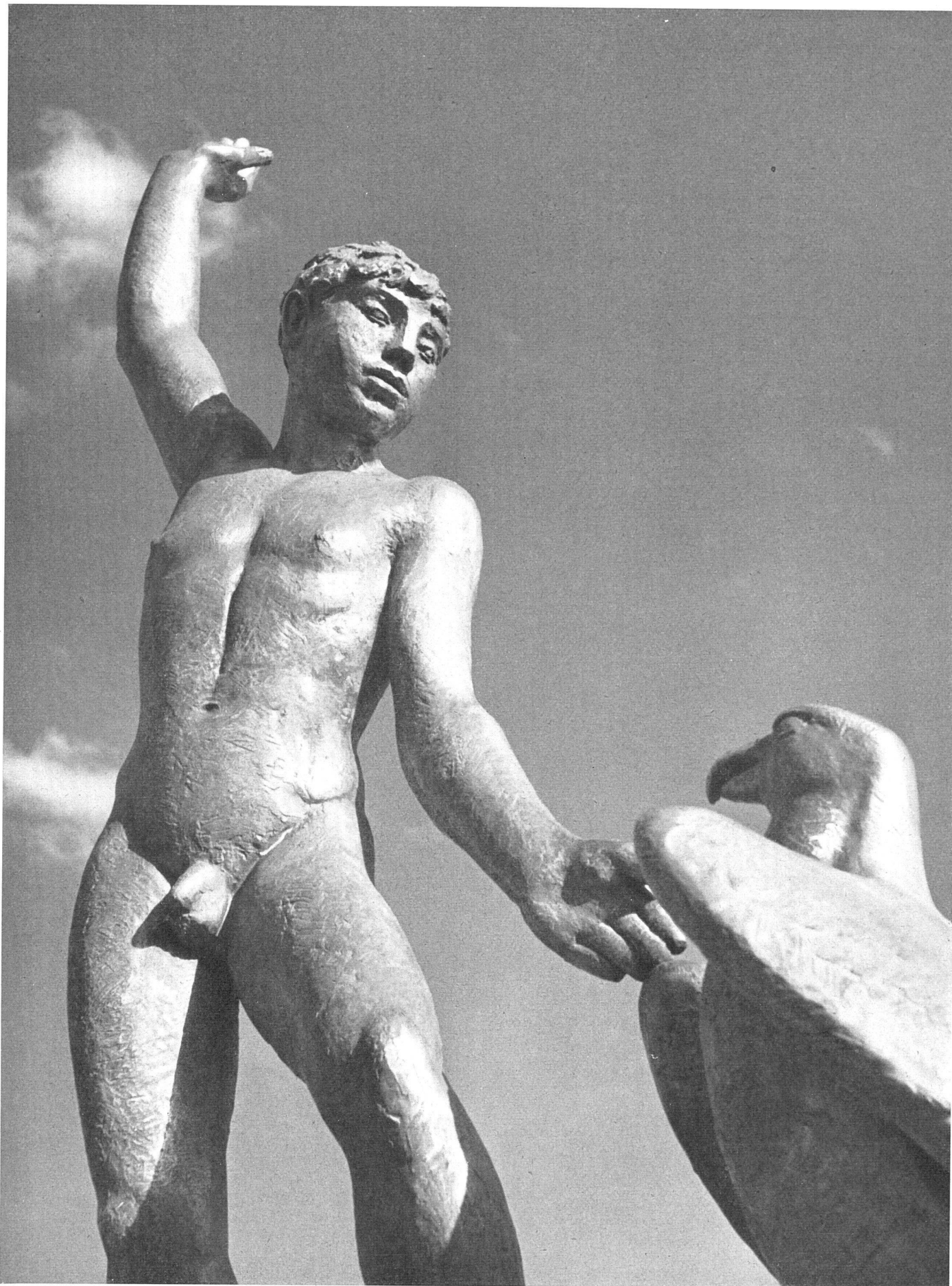
Hermann Hubacher, Ganymed, Detail der Bronze auf der Bürkliterrasse, Zürich | Ganymède | Ganymede