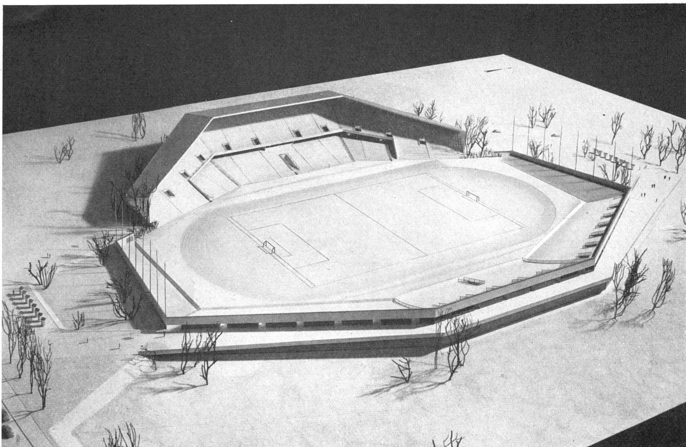
Ansicht des Modells von Nordwesten, im Vordergrund Zugangsrampen, links und rechts Kassen, im Hintergrund gedeckte Tribüne | La maquette vue du nord-ouest; au premier plan les rampes d'accès, à g. et à dr. les caisses | The model seen from the north-west