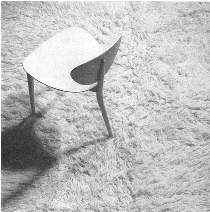
Langhaariger Wollteppich «Velenzes» | Tapis de laine à poils longs | Long-haired wool-carpet