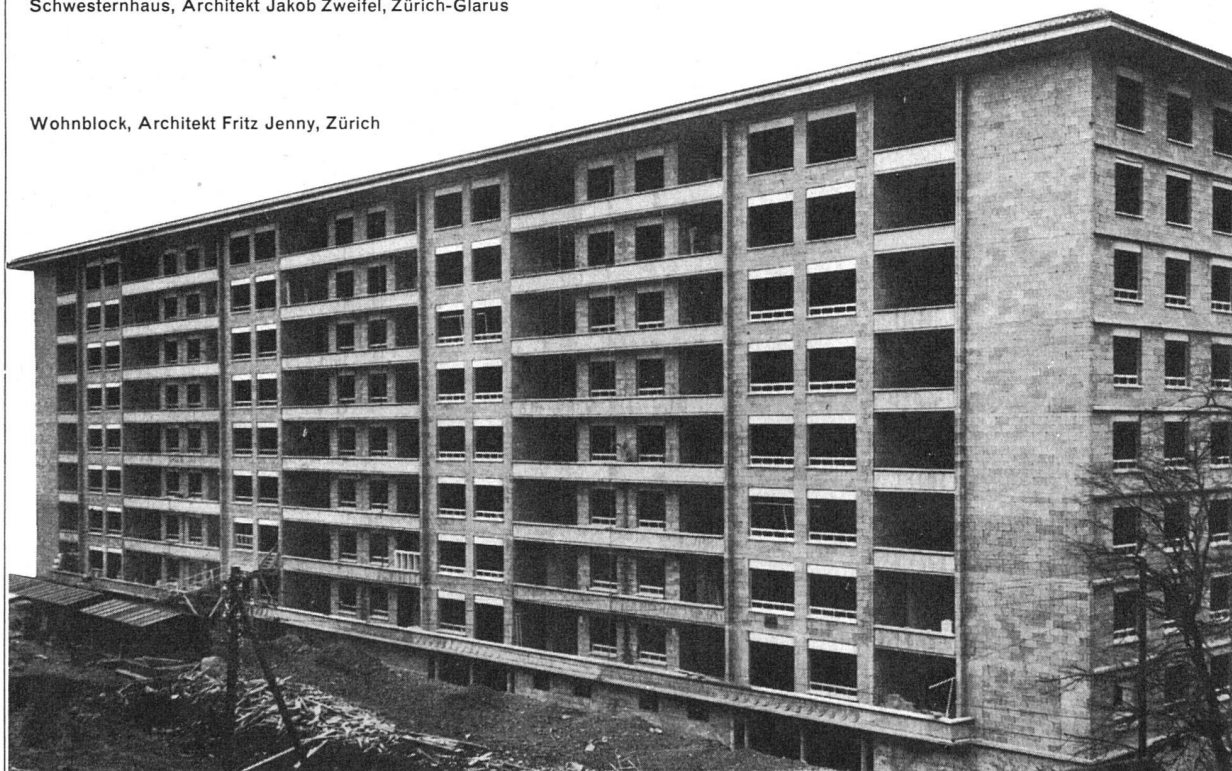
Wohnblock, Architekt Fritz Jenny, Zürich