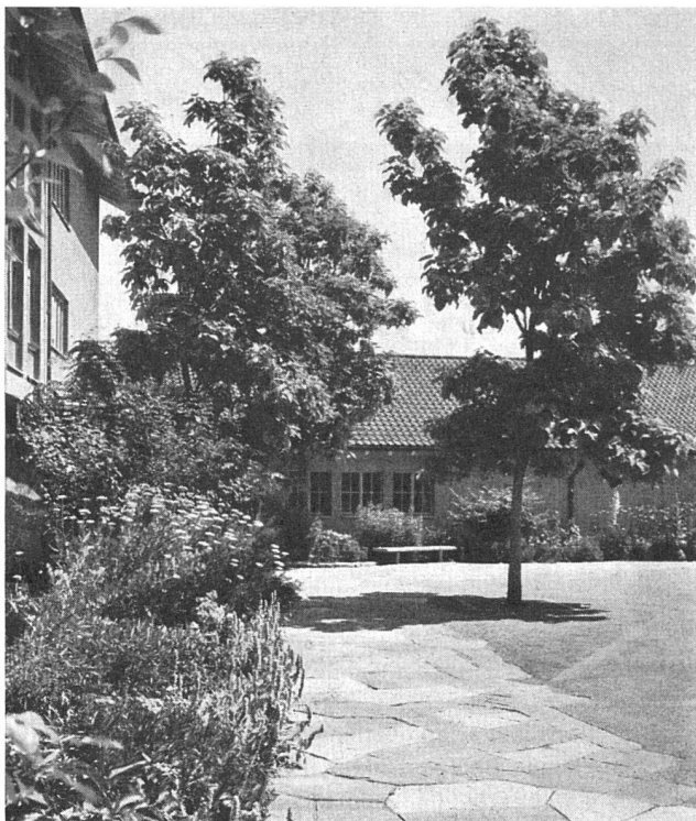
PAUSENPLATZ ZU EINEM SCHULHAUS WALTER LEDER GARTENARCHITEKT BSG ZÜRICH