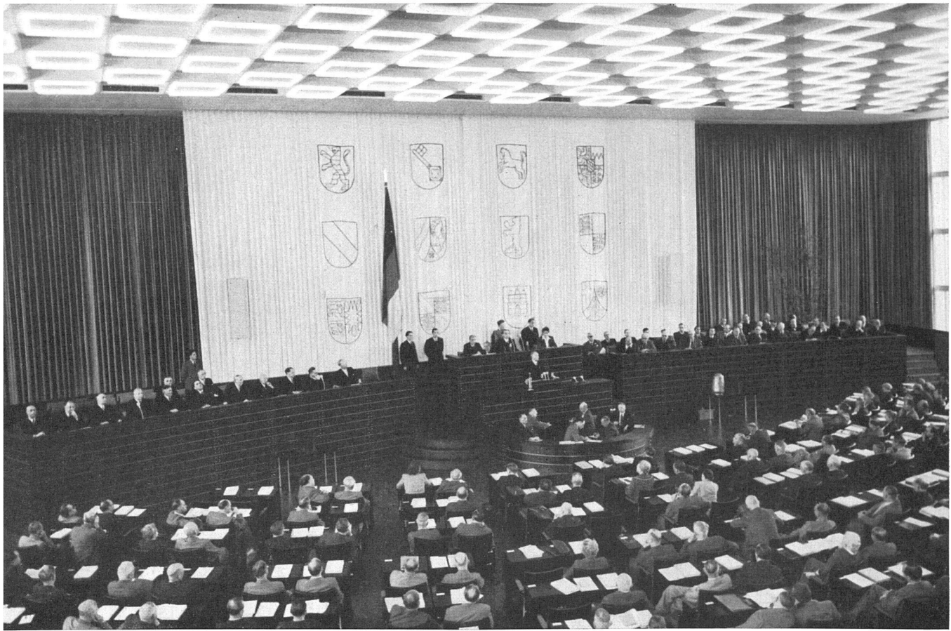
arsaal, 850 Sitzplätze. Bundeskanzler Dr. Adenauer stellt sein Kabinett dem Bundestag vor (20. 9. 1949). Vorhang mit den 12 Länderwappen in aus weißem Velours. Schwingstühle und Pulte schwarz, Polster grünes Leder | Salle des séances du Parlement | The parliament hall, Chancellor Adenauer presenting his cabinet (20. 9. 1949)