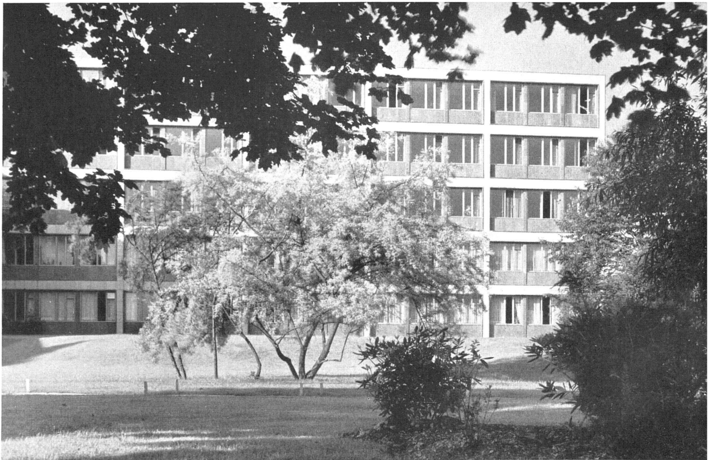
Westansicht des Nordflügels. Eisenskelettbau, Verkleidung mit gelbgrauem Tuffstein, Brüstungen mit rheinischer dunkelgrauer Basaltlava / L'aile nord (bureaux), façade ouest / West elevation of the northern office wing