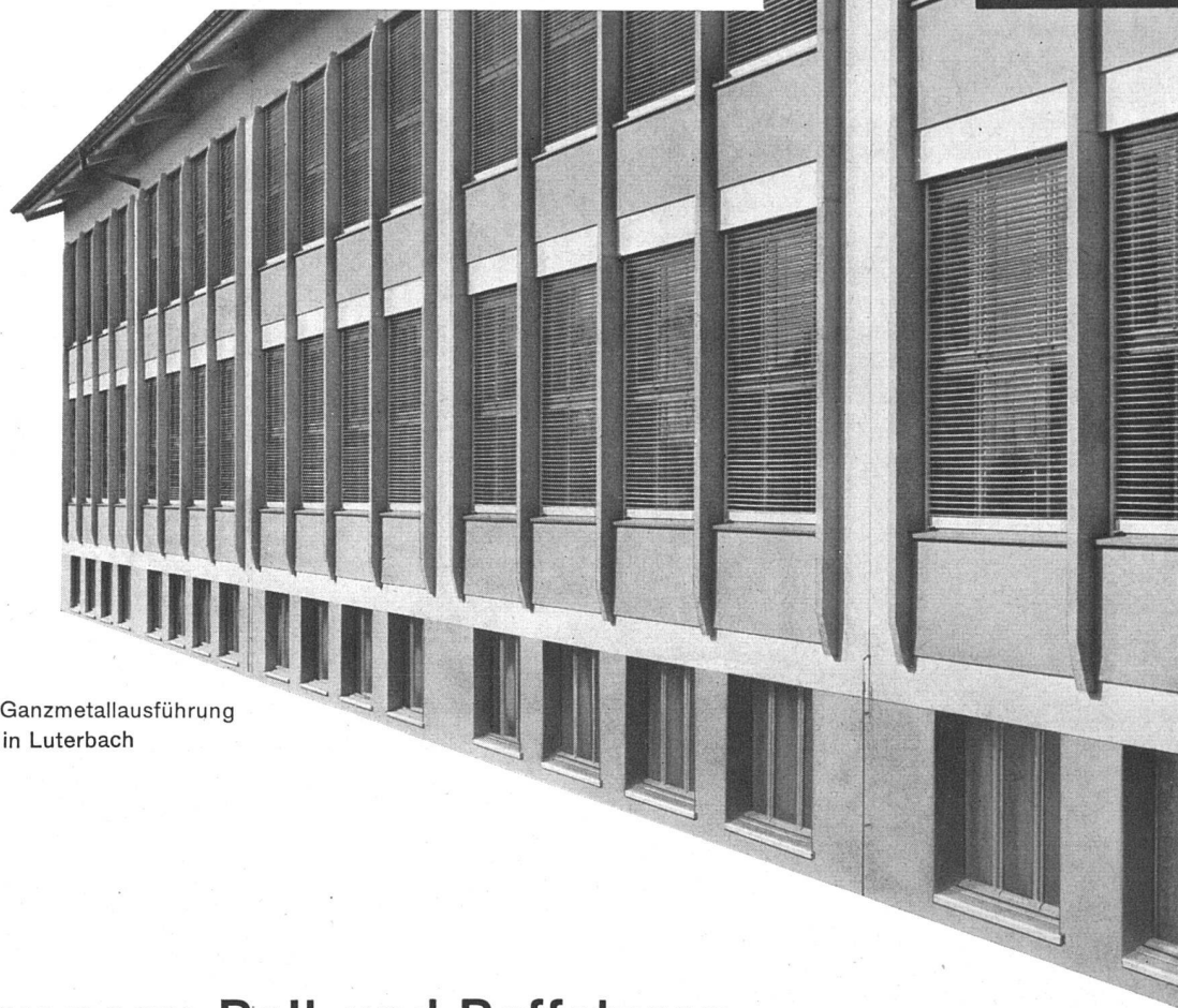
Rollstoren-Ganzmetallausführung Schulhaus in Luterbach