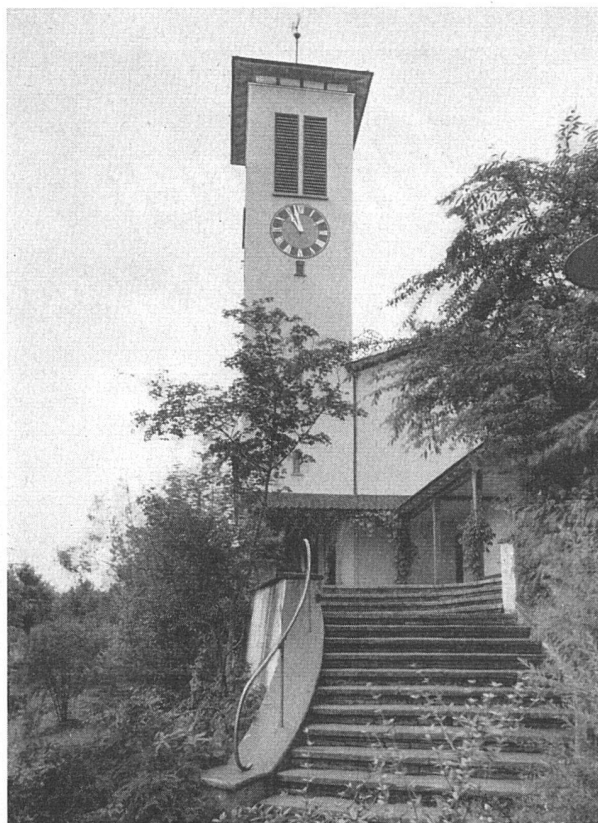
REFORMIERTE KIRCHE FRIESENBERG ZÜRICH

INTERTHERM AG. ZÜRICH 1 Nüscherstraße 9, Telephon 27 88 92 / 27 67 75