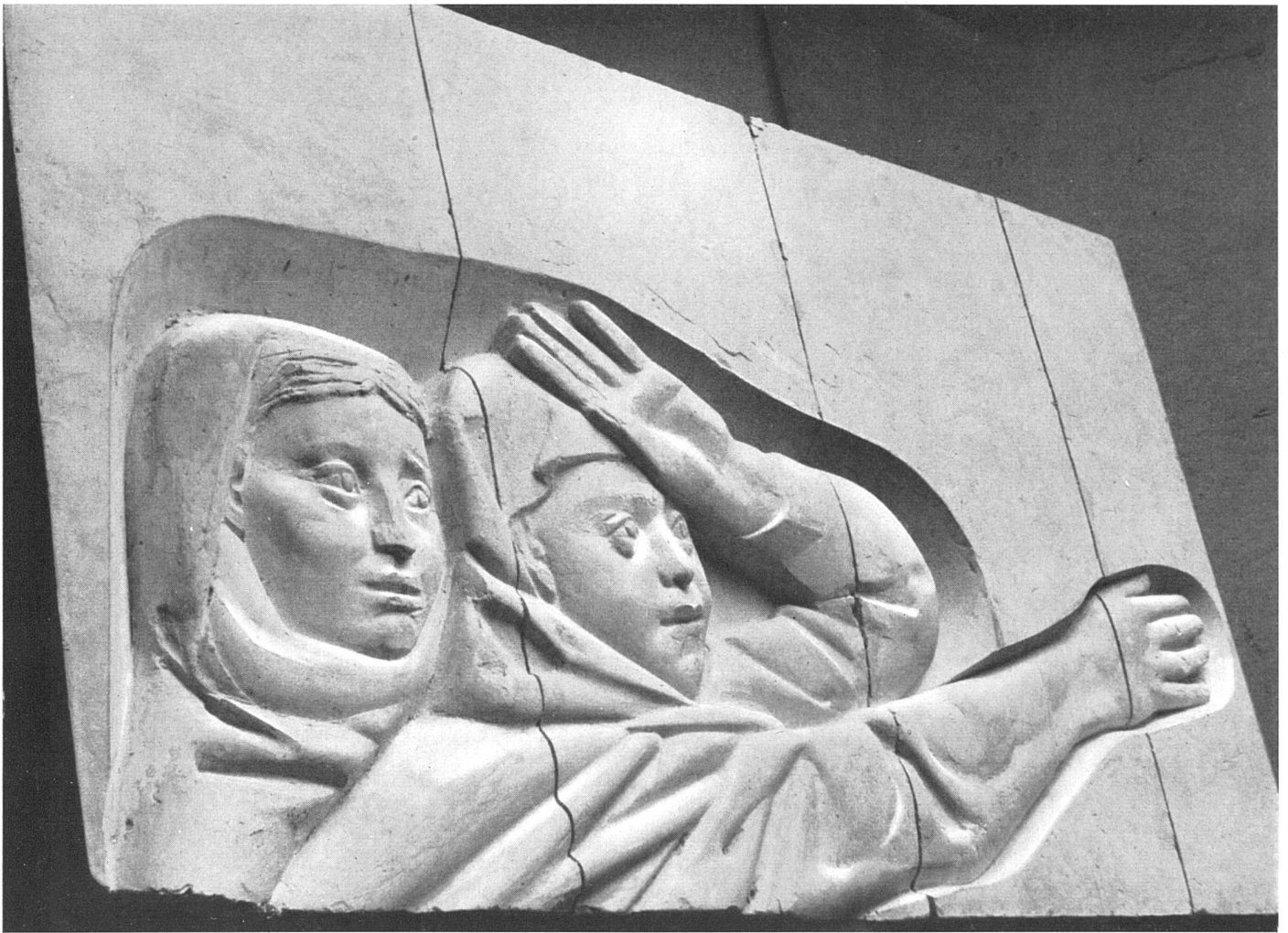
Franz Fischer, Die Schutzflehenden. Linke Hälfte des Wandreliefs in der reformierten Kirche in Altstetten. (Aufnahme nach dem Gipsmodell) | Les suppliants. Moitié gauche du bas-relief de l'église réformée d'Altstetten | Those beseeching protection. Left half of the relief in Altstetten Protestant Church