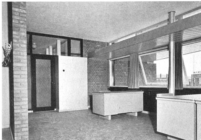
Arztzimmer / Cabinet des médecins / Doctor's room