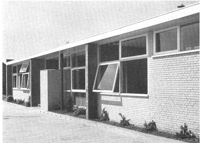
Ausschnitt Südfassade / Partie de la façade sud / Part of south elevation

Medizinische und soziale Hilfs- und Beratungsstelle für Hafenarbeiter der Schiffahrtsgesellschaft «Zuid» / Centre médical et social ouvrier / Medical and social centre for dock workers.