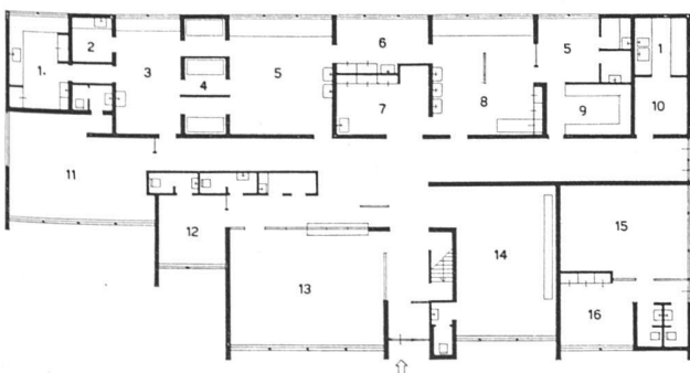
Grundriß 1:400 / Rez-de-chaussée / Ground floor plan