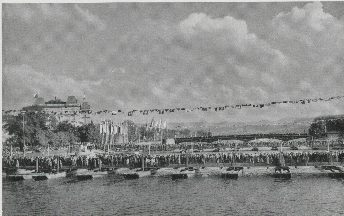
Mittelpunkt der freien Volkspromenade waren die Bellevuebrücke und die beiden Pontonbrücken / Le pont de Bellevue et les deux ponts de ponton mis à la disposition des piétons / The Bellevue Bridge and the two pontoon bridges for free use by the pedestrian