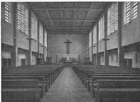
Kath. Kirche Amriswil Paul Büchi, dipl. Architekt SIA, Amriswil