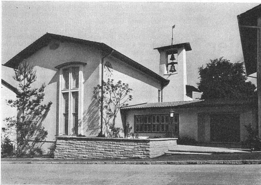
Kirche «Hoffeld» Zürich-Untersträß