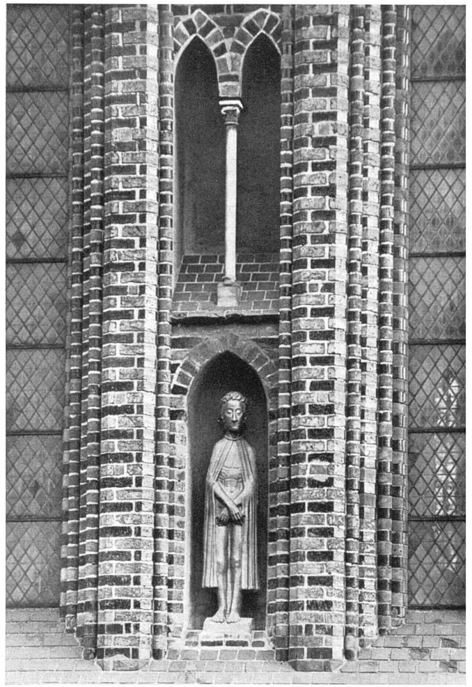
Gerhard Marcks, Christus als Schmerzensmann, Klinker. Fassaden- figur an der Katharinenkirche, Lübeck. 1948 | L'homme de douleur. Brique hollandaise | Christ as Man of Sorrows, Clinker