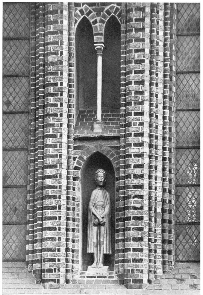
Gerhard Marcks, Christus als Schmerzensmann, Klinker. Fassaden- figur an der Katharinenkirche, Lübeck. 1948 | L'homme de douleur. Brique hollandaise | Christ as Man of Sorrows, Clinker