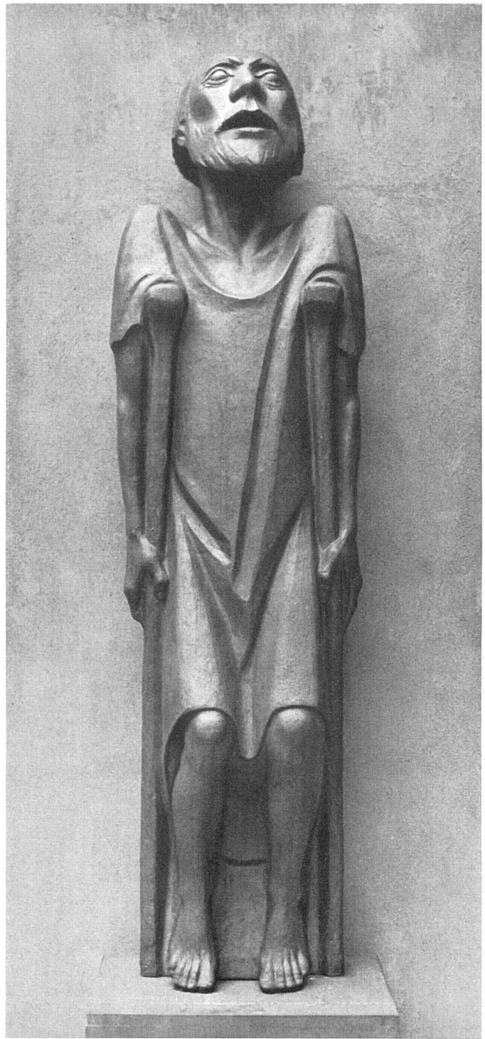
Ernst Barlach, Bettler; Fassadenfigur an der Katharinenkirche, Lübeck. Klinker, 1930 | Mendiant. Brique hollandaise | Beggar. Clinker