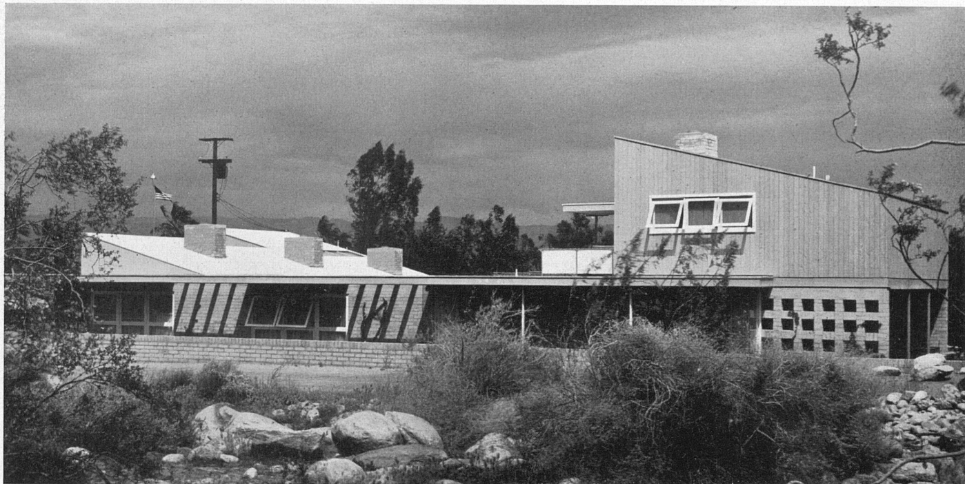
Gesamtansicht von Westen, rechts das Studio des Besitzers | Vue générale prise de l'ouest; à gauche le studio du propriétaire | General view from west, showing at right the owner's studio