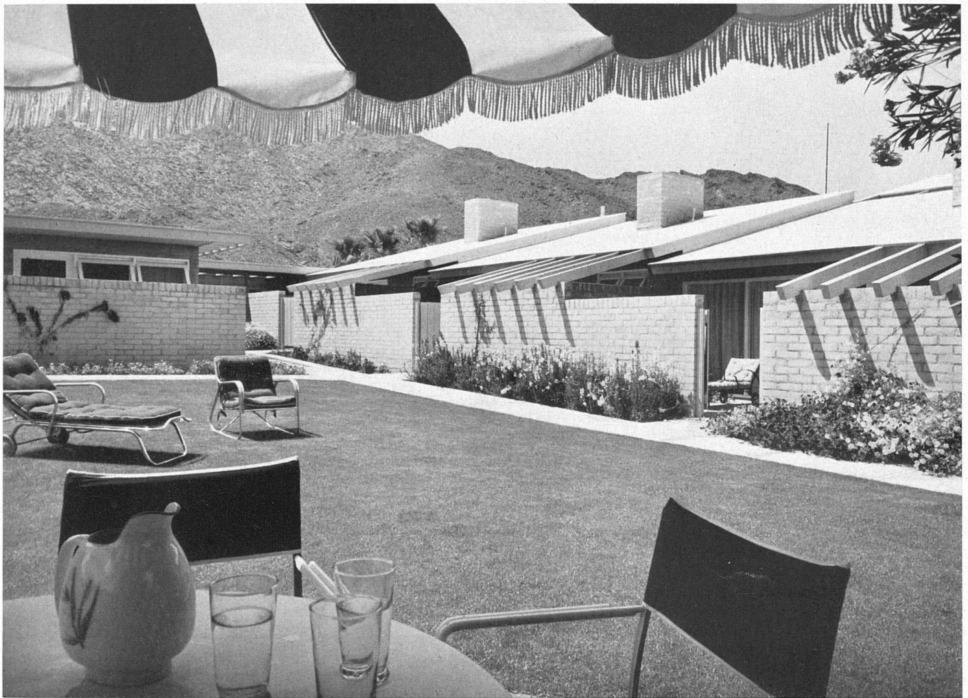
Die vermietbaren Ateliers vom Gartenhof gesehen / Façade sud des studios South elevation of the rented studios