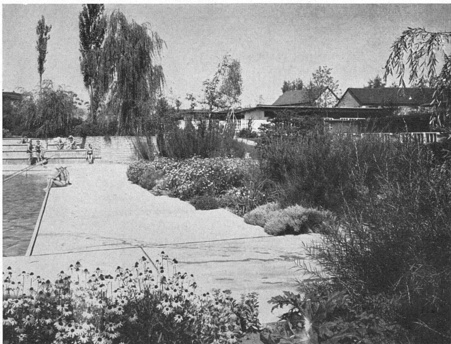
Freibad Letzigraben, Zürich. Staudenflora um das Schwimmbecken. Gartengestaltung: Gustav Ammann BSG, Zürich | Bains du Letzigraben. Verdure autour de la piscine des nageurs | Letzigraben open-air swimming-pool, Zurich. Shrubbery around pool

Mit diesen vorbildlichen Anlagen hat sich die Stadt Zürich nicht nur benutzbare Parkbäder geschaffen, die ihrer Bevölkerung zugute kommen und auch im Ausland anregend wirken, sondern auch im Rahmen ihrer Grünflächen-Politik einige verheißungsvolle Akzente gesetzt. Ihr Vorzug liegt in der Freiheit und Lockerheit sowohl der baulichen wie der gärtnerischen Gestaltung. Es hat sich gezeigt, daß, selbst bei Überbenutzung, das Publikum die Anlagen schont; dank guter Pflege sind keinerlei Beschädigungen weder an Baum und Strauch noch an den vielen Blumen entstanden.