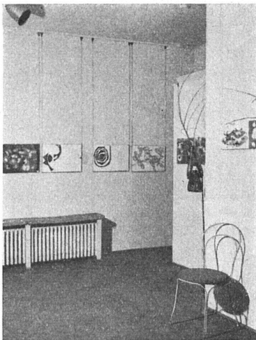
Aus der Ausstellung Gottfried Honegger in der Galerie 16, Zürich.