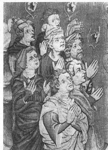
Gruppe anbetender Männer. Detail aus der Anbetung des siebenköpfigen Leoparden

die Ausführung der Teppiche, die für das Schloß in Angers bestimmt waren, wurde dem besten Pariser Wirker der Zeit, Nicolas Bataille, anvertraut. Während rund 20 Jahren ist an diesem Werk gearbeitet worden. Die ganze Tapisserie war aufgeteilt in sieben Bildteppichfolgen von je etwa 6 Metern Höhe und 24 Metern Länge. Jedes Stück bestand aus zwei übereinander angeordneten Reihen von je sieben Apokalypse-Szenen in Querformat sowie einer großen, in Hochformat den beiden Bildabfolgen vorausgehenden Darstellung eines überlebensgroßen alten Mannes, der unter einem eleganten gotischen Thronhimmel sitzt und über dem heiligen Buch meditiert. Unter den Bildreihen zog sich eine mit Gräsern und Blumen verzierte Erdbordüre hin; über den Szenen war ein Himmelsband mit stilisierten Wolken und musizierenden Engeln. Aber die Tapisserien haben durch die Jahrhunderte schwer gelitten, und von den ursprünglich 105 Szenen sind nur noch 72 erhalten. Von diesen sind 38 der schönsten, dabei auch die einzige noch erhaltene vollständige Folge, zusammen mit zeitgenössischer französischer Plastik, Manuskripten und Elfenbeinschnitzereien, in der Basler Kunsthalle ausgestellt. Die weite Hängung und eine neu eingerichtete Beleuchtung ermöglichen dem Besucher die uneingeschränkte Betrachtung dieses immer stärker faszinierenden Kunstwerks. Jede oftmals versuchte Unterscheidung zwischen Kunst und «nur»