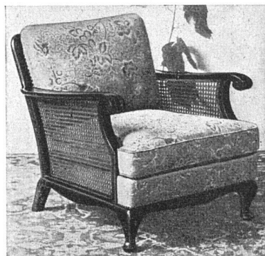
Die ersten mottensicheren Polstermöbel