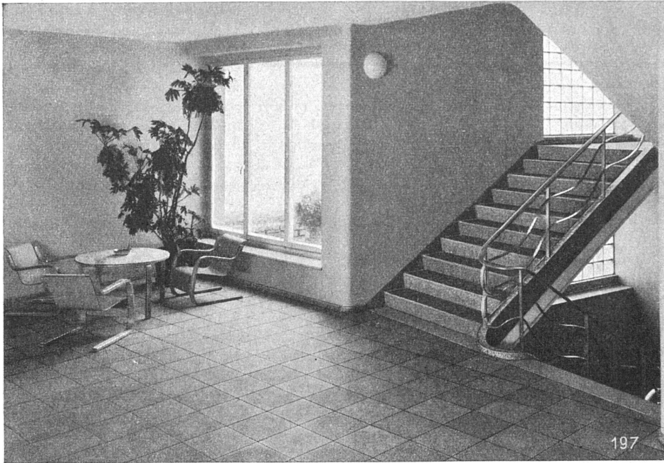
Frauenspital St. Gallen 1940/41

Fassaden- Verkleidungen Treppenanlagen Bodenbeläge in Basaltolit Betonfenster