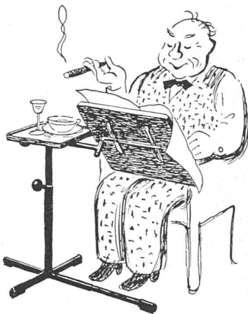
Wir stellen vor: Herr Ufenast samt Caruelle-Tischchen (=Mittagsrast)