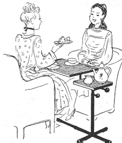
Und hier die liebe Brigitte beim Caruelletisch, mit Tee-Visite