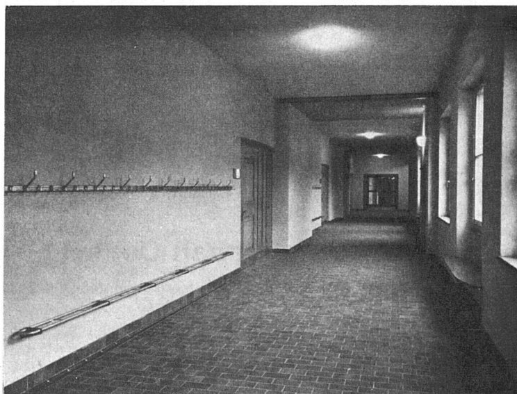
Schulhaus Adliswil 1949

Schulhaus «Im Gut», Zürich Schulhaus Trembley, Genf Schulhaus an der Buchserstraße in Bern Schulhaus Neuenegg/Bern Sekundarschulhaus Konolfingen Schulhäuser Massagno und Molino Nuovo, Lugano, usw.