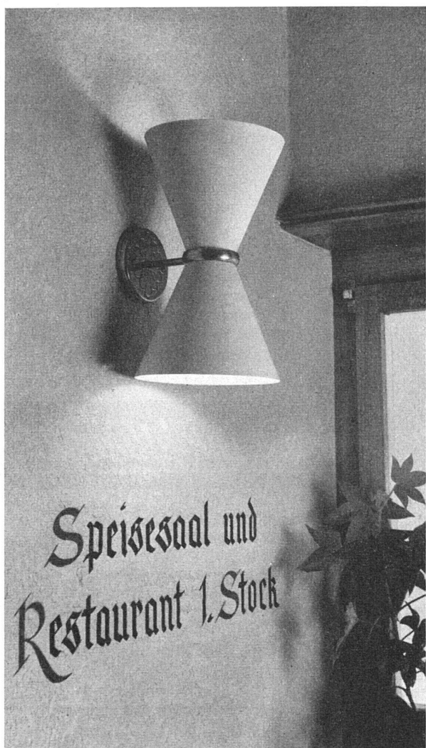
Restaurant Löwen, Kloten