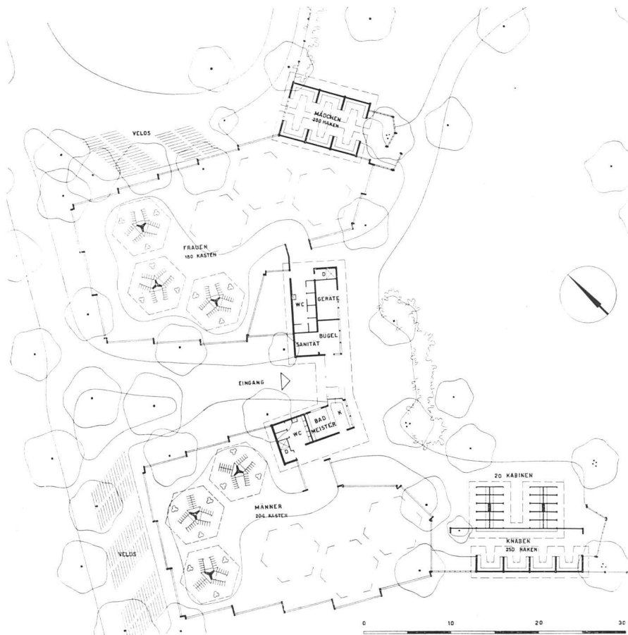
Grundriß der Eingangspartie 1:600 | Plan de l'entrée | Entrance plan