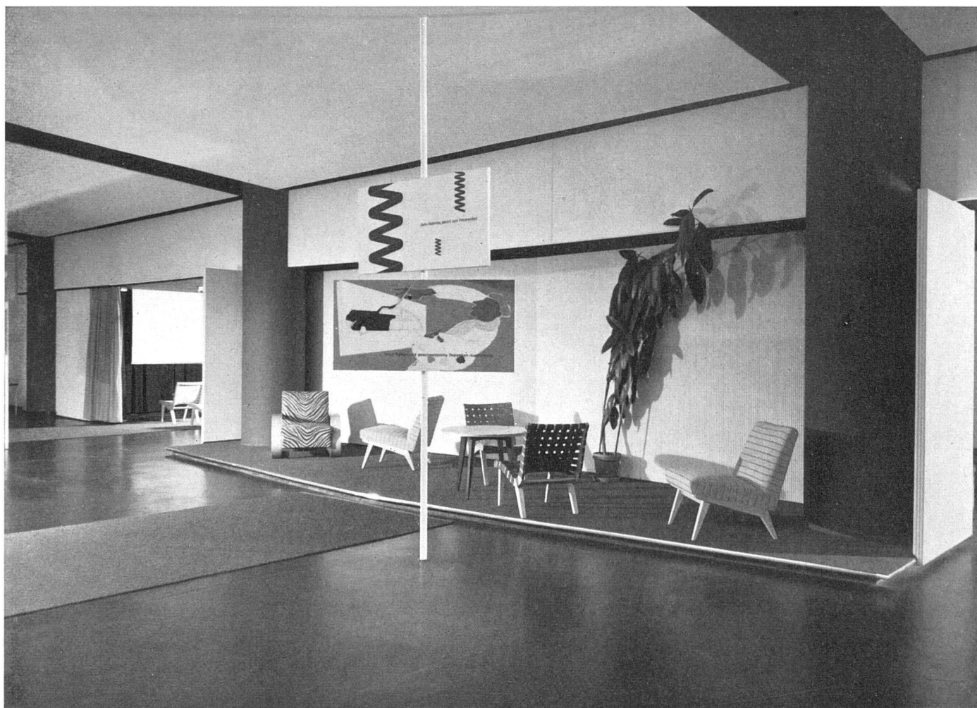
Nische für Kundenberatung. Mobiliar: Wohnbedarf AG., Zürich / Coin parloir pour la clientèle. / Recess for advising customers