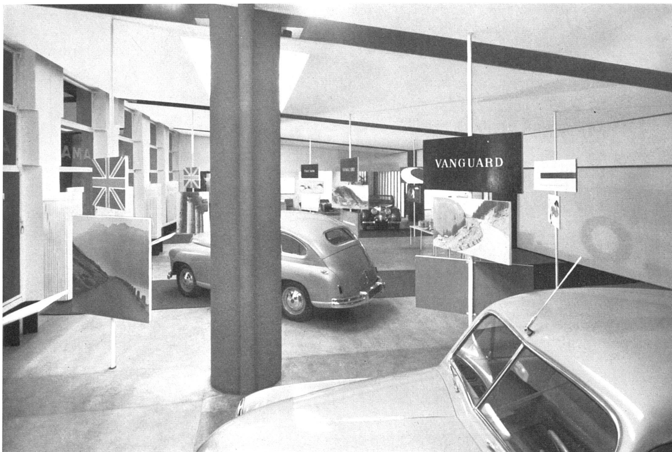
Verkaufs- und Ausstellungsraum, Decke geneigt nach innen / Salle de vente et d'exposition, plafond incliné vers l'arrière / Sales and exhibition room, roofs tending inwards