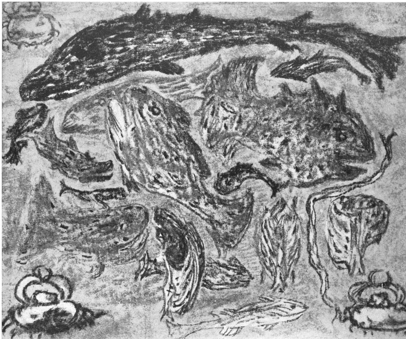
Carl Fr. Hill, Fischschwarm , Farbstift / Banc de poissons; crayons de couleur / Fish Shoal , Crayon Drawing