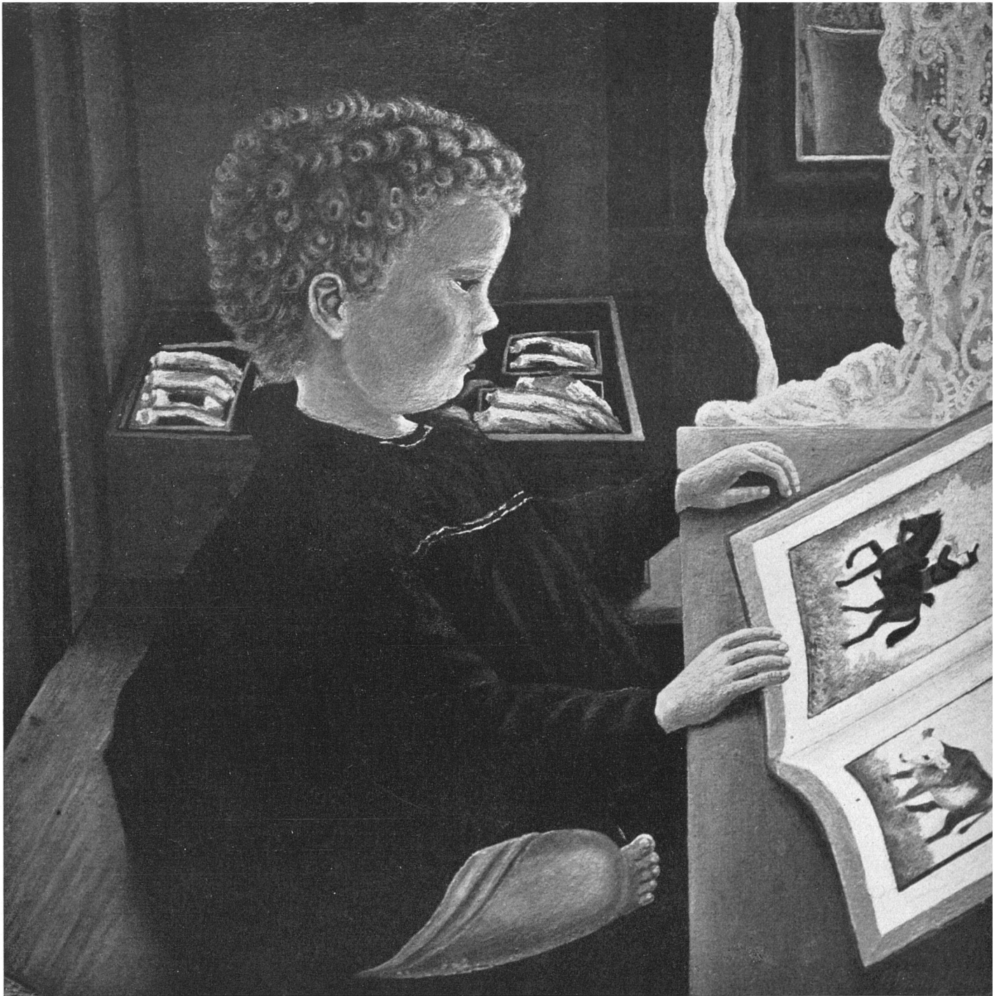
Adolf Dietrich, Knabe mit Bilderbuch / Garçonnet regardant un livre d'images / Boy with Picture Book