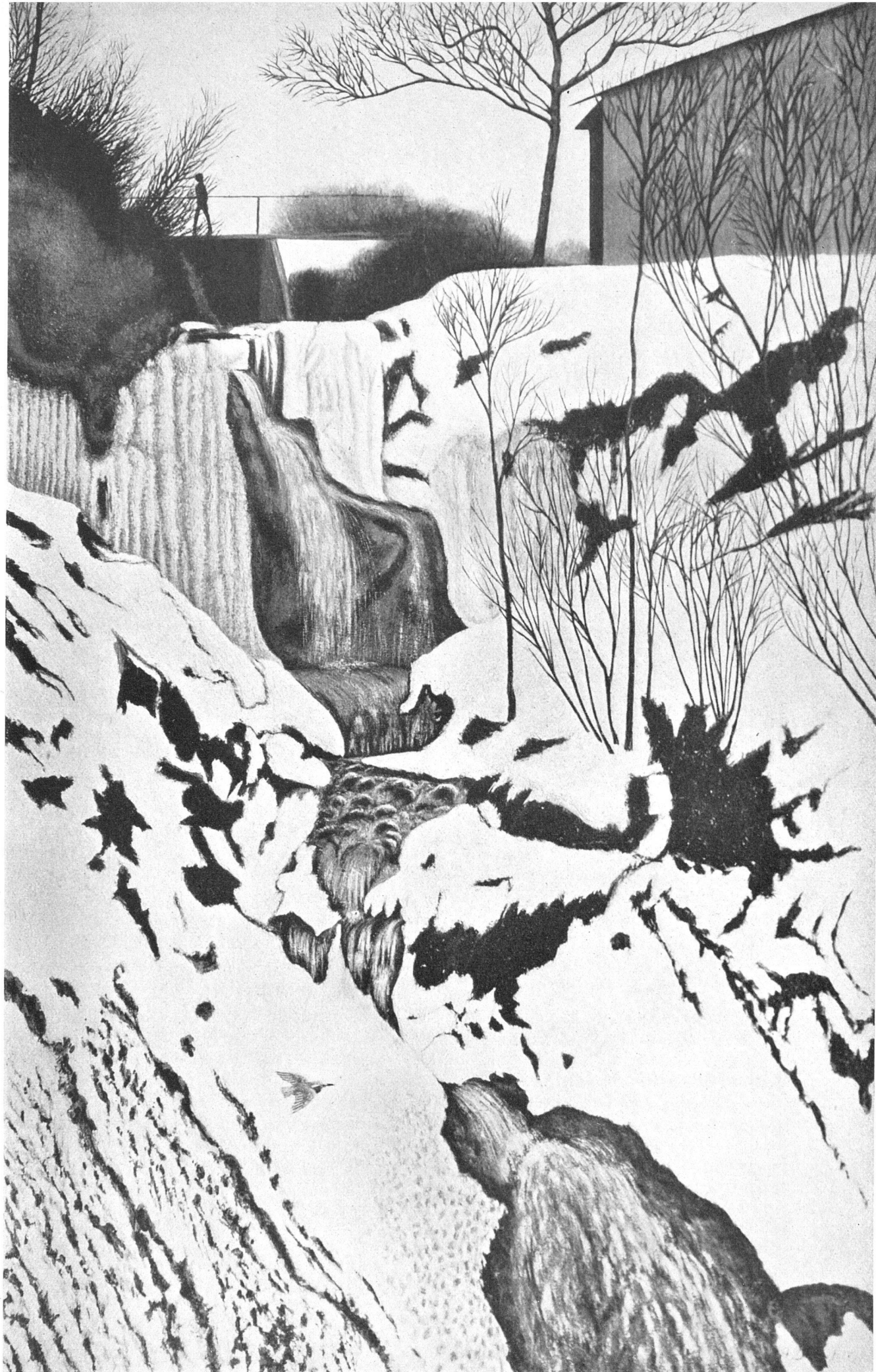
Adolf Dietrich, Wasserfall im Winter / Cascade en hiver / Waterfall in winter