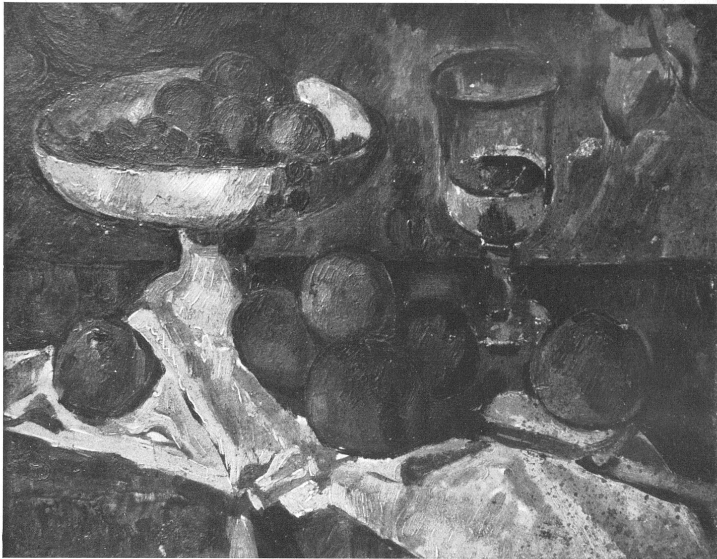
Marcel Ponce, Nature morte au compotier / Stilleben mit Fruchtschale / Still life with fruit-dish