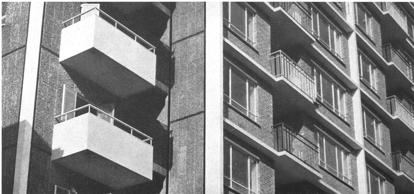
Fassadenausschnitt. Fassadenverkleidung links aus vorfabrizierten Betonplatten mit eingelegtem Ziegelschrot, Betonflächen weiß / Partie de la façade sud. Les façades de gauche sont revêtues de dalles en béton préfabriquées et dont la surface est composée de débris de brique / Part of south elevation. The flank façades at left are clad with prefabricated concrete slabs with a surface composed of broken brick

Im Holborn-Bezirk ist das bisher größte Wohnbauprojekt Londons in Ausführung begriffen. Es umfaßt das hier veröffentlichte zehngeschossige und weitere siebengeschossige Laubenganghäuser für insgesamt 4000 Personen. Dazu gehören Laden- und Gemeinschaftszentren, eine Primarschule, Kindergärten. Die Größe der Wohnungen variiert von 1 bis 4 Zimmern; ihre Zahl und Art entspricht den sozialen Forderungen der für diese Wohnungen eingeschriebenen Interessenten.