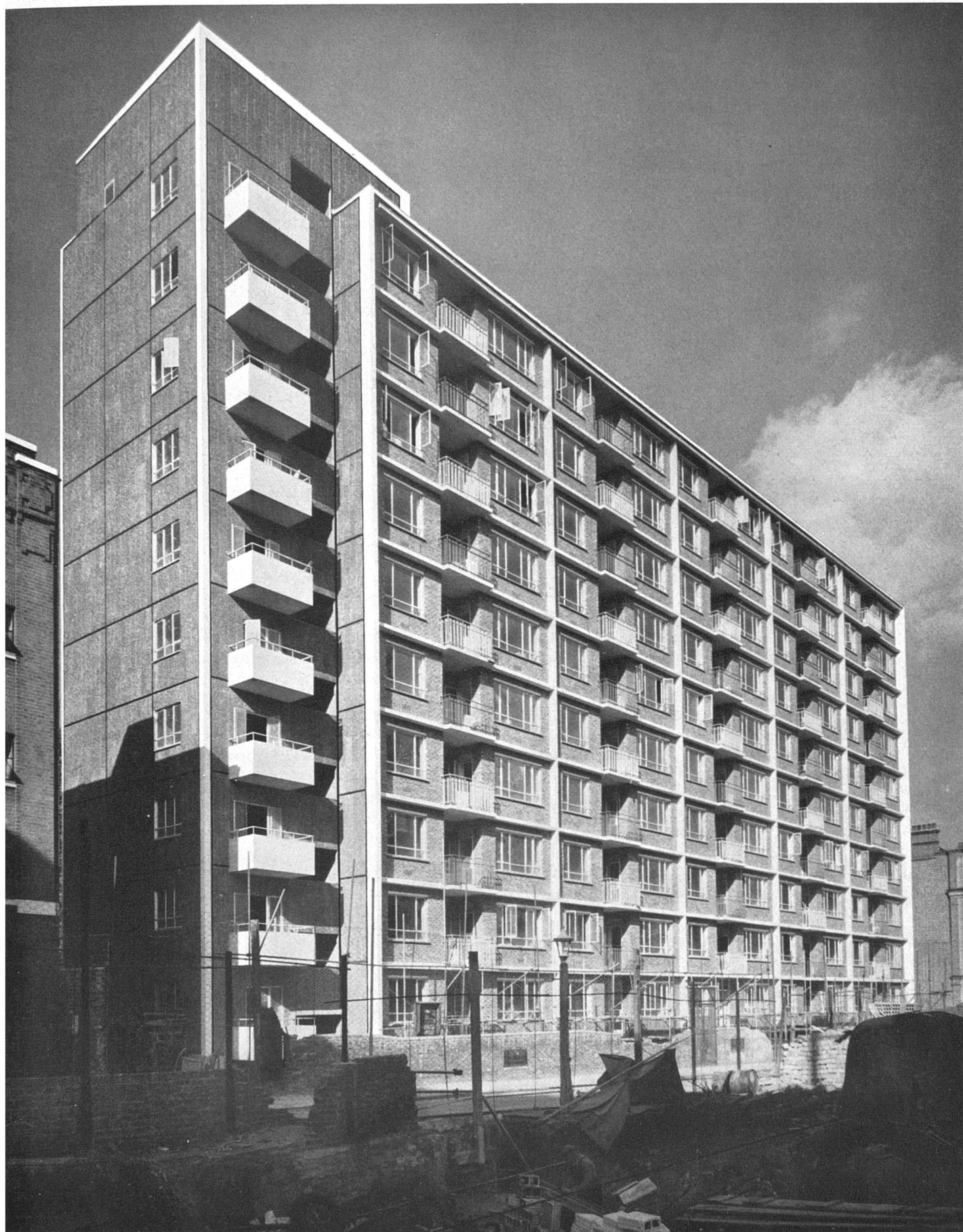
Südansicht, Dombey Street, Holborn, links Treppenhaus mit Waschküchen, ganz oben Wasserreservoir / Façade sud; à gauche, la cage d'escalier et, sur chaque étage, les buanderies / South elevation, at left the staircase and on each floor the laundries