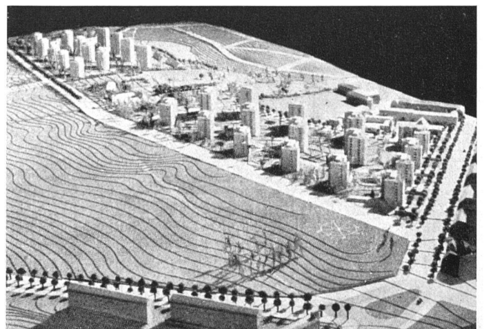
Dänischer Vorschlag für Turmhaussiedlung. Die zu große Wiederholung desselben Bautypes führt zu Einförmigkeit | Projet danois pour des «tours d'habitation». L'emploi trop répété du même type de bâtiment engendre la monotonie | Danish project for «apartment towers». The frequent repetition of the same building type results in monotony

Diese Gefahr kann jedenfalls durch den dem Leben eher entsprechenden vielgestaltigen Quartieraufbau gebannt werden. Es kann eine Einheit höherer Ordnung, beruhend auf Wechselwirkung und Ausgleich der architektonischen Elemente geschaffen werden.