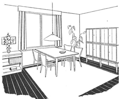
Esszimmer mit Typenmöbeln von W. Wirz SWB, Innenarchitekt, Sissach