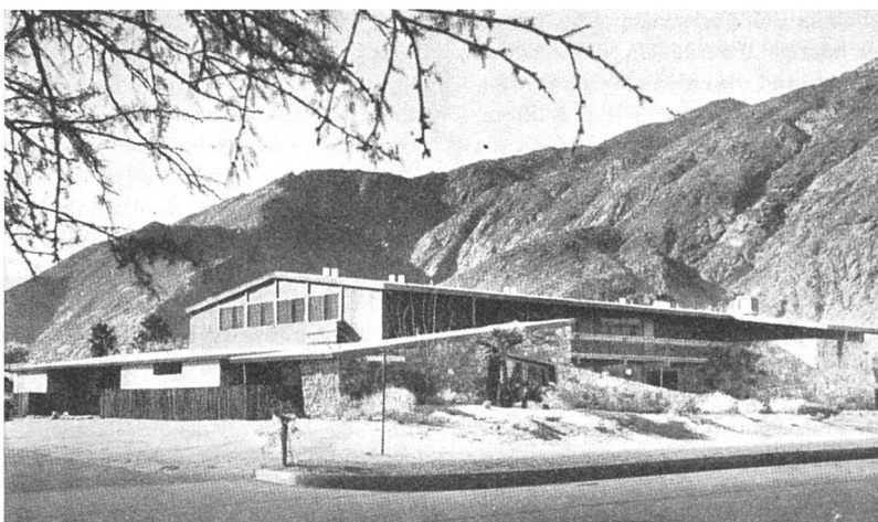
Del Marcos Hotel in Palm Springs (Kalifornien). Architekt William F. Cody. Gesamtansicht.

In der Möbelabteilung sah man in Holz und Eisen ansprechende Typen von spezialisierten Einzelmöbeln, während die traditionellen Ausstattungen sich wie überall in ungenießbarer dekorativer Pracht entfalteten. Bei der Keramik fiel auf, daß trotz des enormen Nachholbedarfs – von dem man sich in jedem englischen Hotel oder Haushalt einen Begriff machen kann – überwiegend die altbewährten geblumten und reich dekorierten Muster gepflegt und nur sporadisch Neues, das überzeugt hat, gezeigt wurde. Eindrucksvoll waren die Stände der überseeischen Staaten des britischen Com-