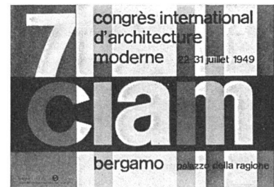
Kongreßplakat von Max Huber, Mailand