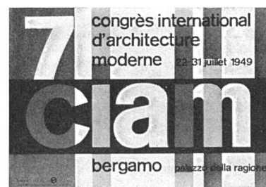
Kongreßplakat von Max Huber, Mailand