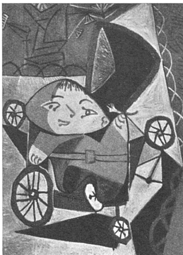
Pablo Picasso, Kind im Wagen , 1949.

Wie es zu erwarten war, ist der Salon des Réalités Nouvelles bedeutend zusammengeschmolzen. Einerseits ist daran wohl das sehr ausschließliche und dogmatisch streng begrenzte Manifest der Réalités Nouvelles, andererseits aber eine gewisse Konfusion der Tendenzen schuld, eine ungenaue Terminologie der einmal «abstrakt», einmal «konkret» und dann wieder «nicht figürlich» oder «ungegenständlich» genannten Kunstrichtung. Die Schwierigkeit einer Einigung besteht wohl gerade darin, daß das Geistige in der