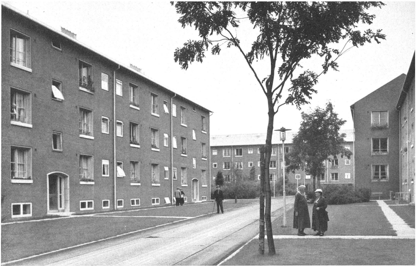
Zugangsstraße mit Blick in den Gartenhof | Voie d'accès et cour-jardin | Access road and garden court