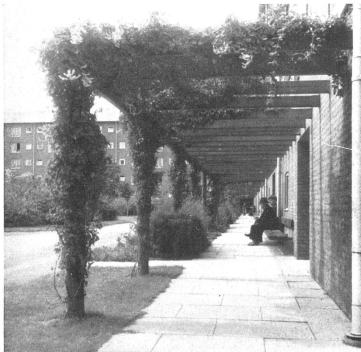
Pergola im Gartenhof | Pergola de la cour-jardin | Pergola in the garden court