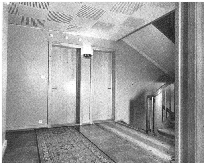
Umgebauter Treppenvorplatz / Palier du nouvel étage / Staircase landing after remodelling

Umbaukosten: Fr. 301 000.- oder Fr. 3010.- pro Fremdenbett.