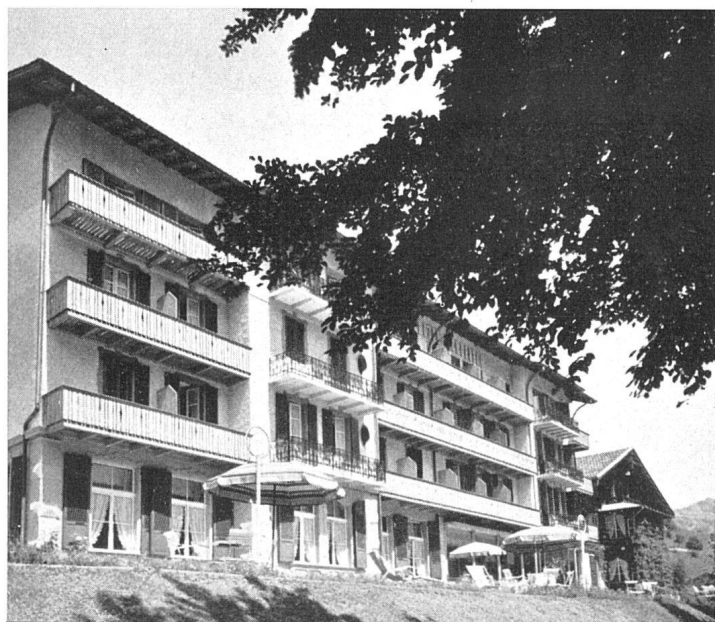
Südfront mit neuem 3. Geschoß und neuen Balkonen / Façade sud de l'hôtel, avec le nouveau 3ème étage / South elevation with new 3rd floor