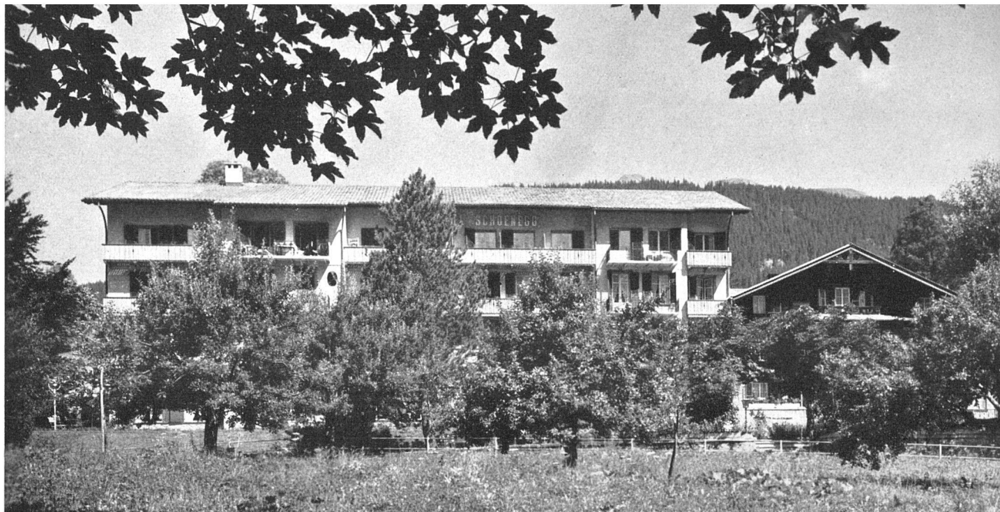
Gesamtansicht des umgebauten Hotels von Süden / Vue générale de l'hôtel après la transformation / South elevation of the remodelled hotel