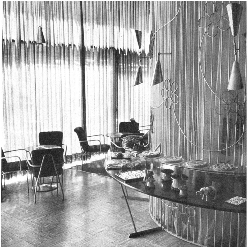
Blick vom Verkaufsraum in den Tea room / Le tea room vu du magasin / The tea room seen from the shop