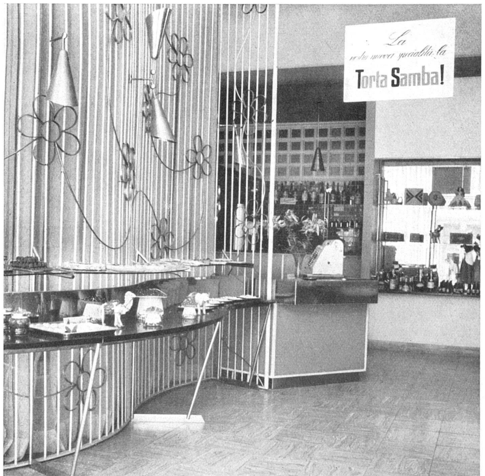
Verkaufsraum mit Kasse, im Hintergrund das Buffet / Le magasin; au fond le bar / Part of the shop with cash-desk and buffet-bar