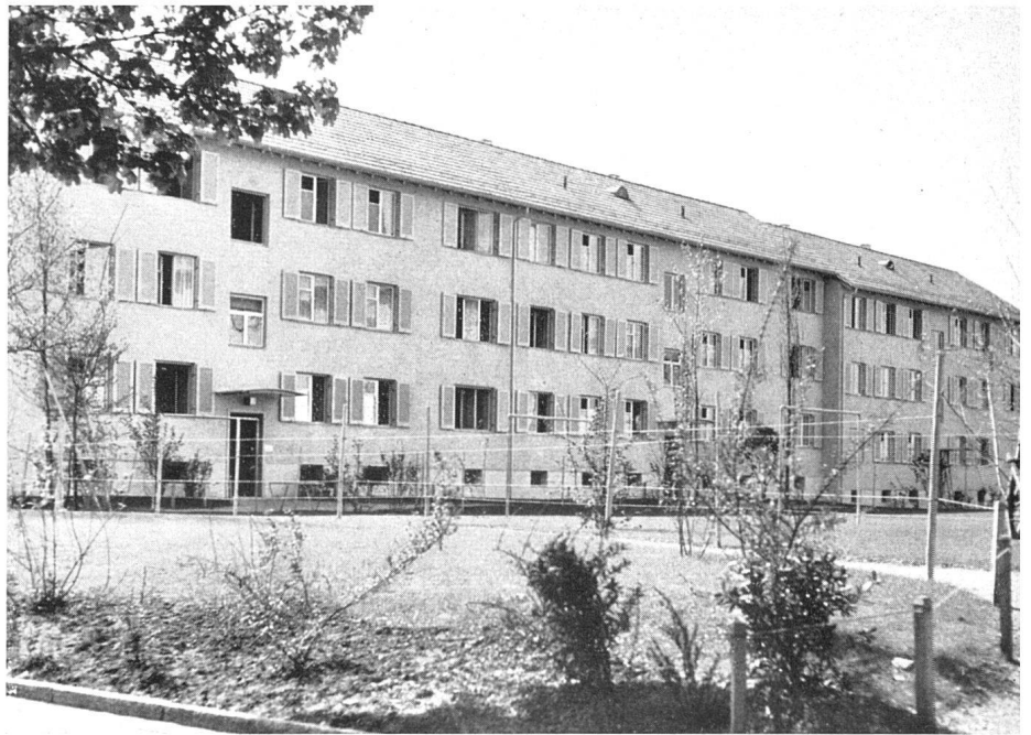
Wohnbauten in Zürich, ausgeführt im System Schindler/Göhner 1947. Bauzeit 3 Monate. Kos 10–15% billiger als bei normaler Bauweise / Ce système permet la construction à étages multiples d'habitations bon marché à Zurich / A system for multistory houses, block of flats in Zurich

Le système intéressant consiste en principe de grands éléments de paroi et de plancher, et d'une structure en béton armé avec coffrage perdu. L'intérieur est entièrement préfabriqué tandis que le revêtement extérieur est monté sur place selon les conditions locales.