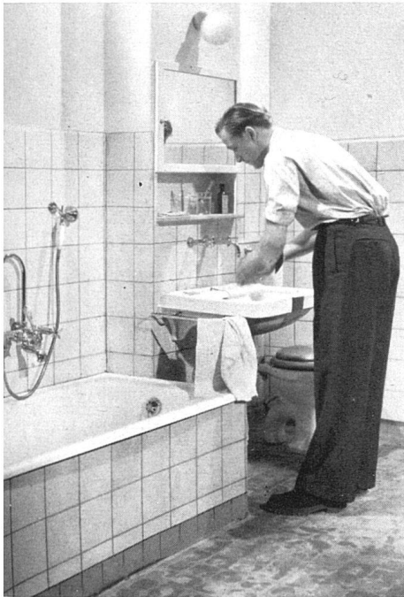
Bad mit Sanitärblock / Bain avec bloc d'eau / Bathroom with sanitary bloc