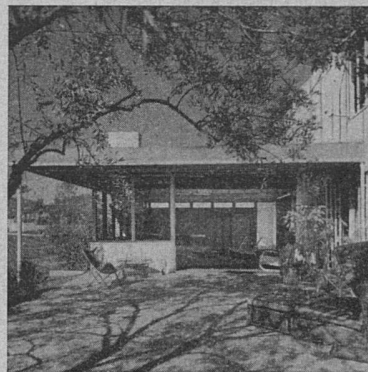
Wohnhaus in Californien. Architekt: R. Neutra

Zeitgemäße Architekturbetrachtung. II. Das Formproblem, von Alfred Roth