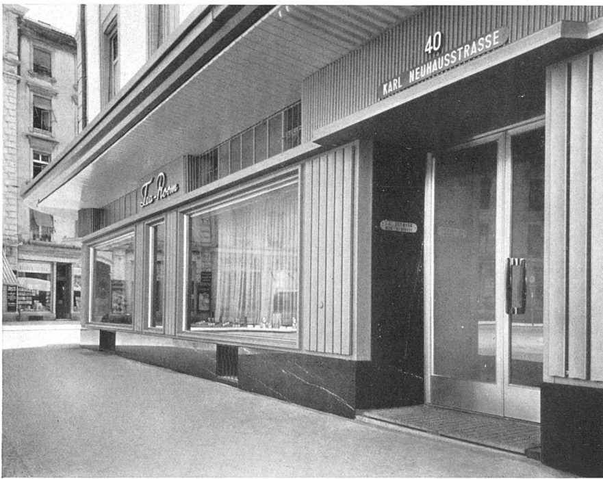
Teilansicht / Partie de la façade / Part of the street front