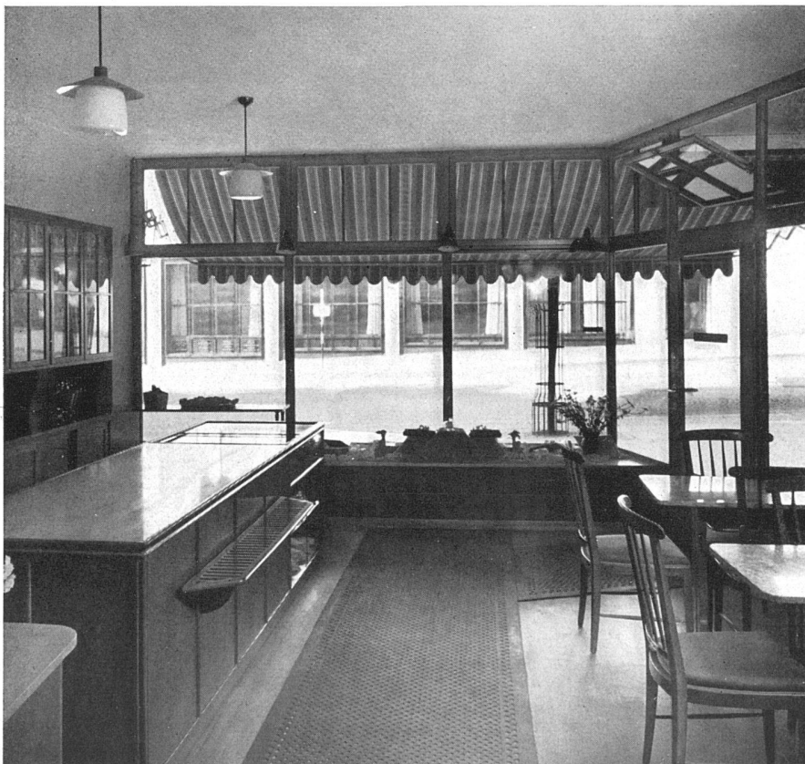
Der Confiserialaden / Intérieur de la confiserie / The interior

Die im Altstadtgebiet gelegene Liegenschaft mußte völlig umgebaut werden. Die schmale Parzelle enthält im Erdgeschoß gegen den Rhein den Tea-Room, gegen die Straße den Confiserialaden, in den vier Obergeschossen Wohnungen und im gegen den Fluß frei liegenden Untergeschoß die Betriebsräume. Konstruktion und Materialien: Die Pfeiler links und rechts bestehen aus Solothurner Kalkstein. Die Schaufensterrahmen sind in naturlackiertem Eichenholz, die unteren Füllungen in weißem Opakglas ausgeführt. Die Sonnenstoren sind blau und weiß gestreift. Für die inneren Schreiner- und Ausbauarbeiten wurde Kirschbaumholz verwendet, für die Möbelbezüge blaue und gelbe Leinen und für die Vorhänge blau und gelb gestreifter Chintzstoff. Die Decke des Tea-Rooms ist hellblau gestrichen mit sgraffitoartigen Malereien von Joos Hutter, Basel.