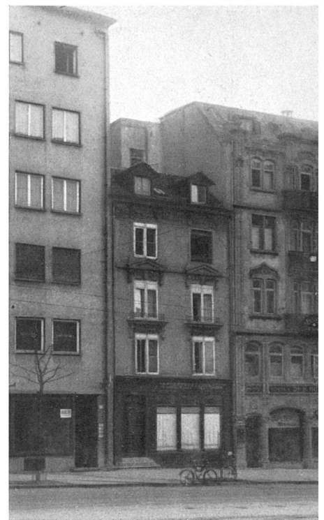
Zustand vor dem Umbau / L'état antérieur Before the remodelling