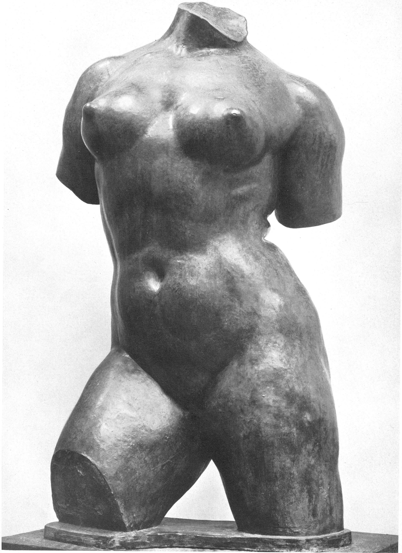
Aristide Maillol, Weiblicher Torso. Studie zur Action enchaînée (Blanquidenkmal). Bronze. Collection Eugène Rudier, Paris