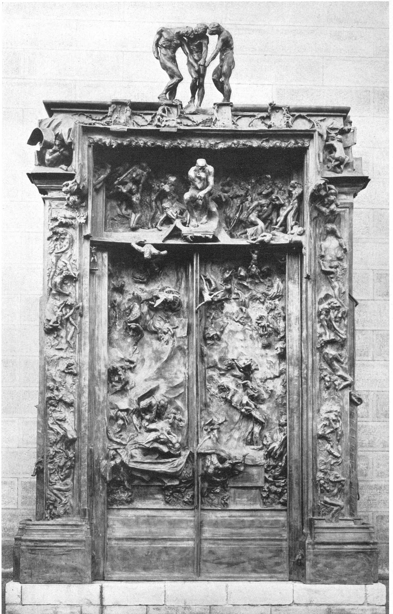
Auguste Rodin, Die Höllenpforte. Collection Eugène Rudier, Paris. Aufstellung vor dem Kunsthaus Zürich (Sommer 1947)