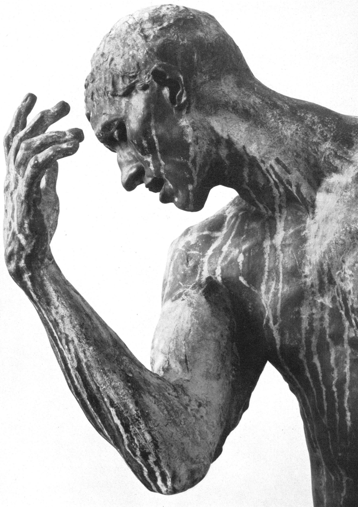
Auguste Rodin, Ein Bürger von Calais . Aktstudie zu der Gruppe (Detail). Bronze | Bourgeois de Calais. Etude de nu pour le groupe (détail) . Bronze | A Citizen of Calais. Study in the nude for the group (detail) . Bronze. Collection Eugène Rudier, Paris