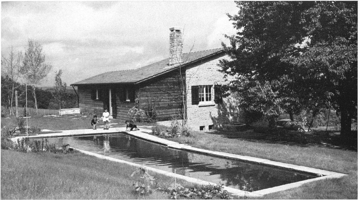
Ansicht von Südost mit Badebecken / Vue prise du sud-est / View from the south-east with bathing-pool