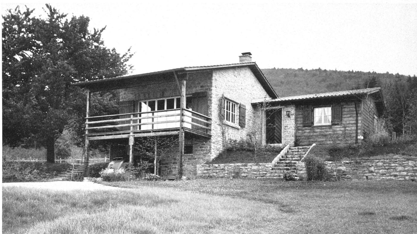
Gesamtansicht von Nordwesten / Vue d'ensemble prise du nord-ouest / General view from the north-east