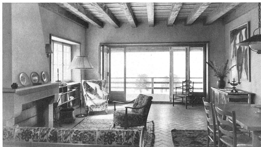
Wohnraum mit Balkonaustritt / Grande salle avec sortie sur le balcon / Living-room opening on to the balcony

Baukosten: Sie betragen im Baujahre 1943 Fr. 69.20 per m 3 umbauten Raumes inklusive Architektenhonorar, jedoch ohne Gartenarbeiten.