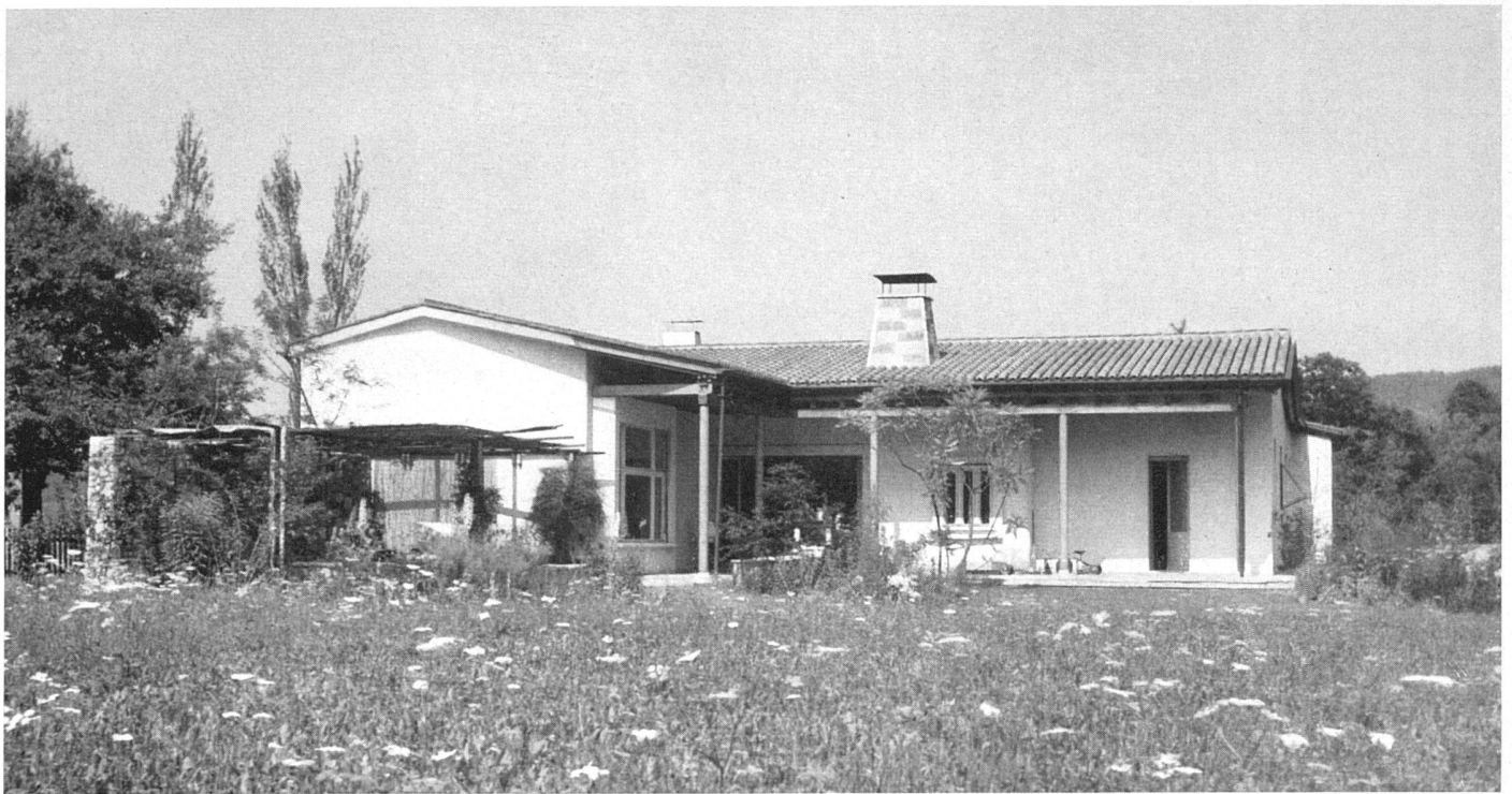
Gesamtansicht von Süden / Vue d'ensemble prise du sud General view from the south