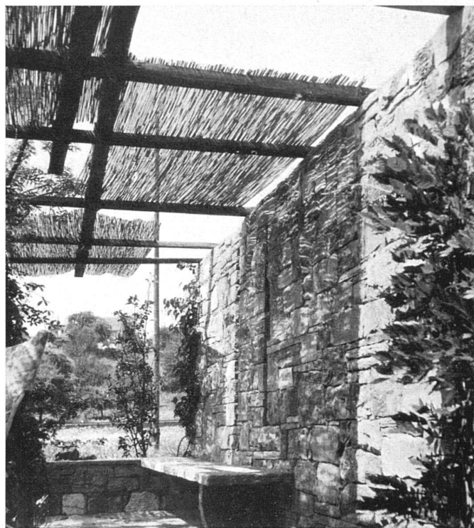
Sitzplatz mit Schutzmauer / Coin de la terrasse protégé par un mur / Sun-and wind-protected corner of the terrace