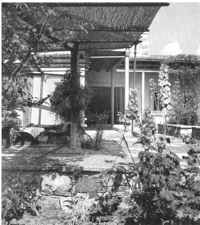
Gartensitzplatz am Haus / La terrasse / The terrace