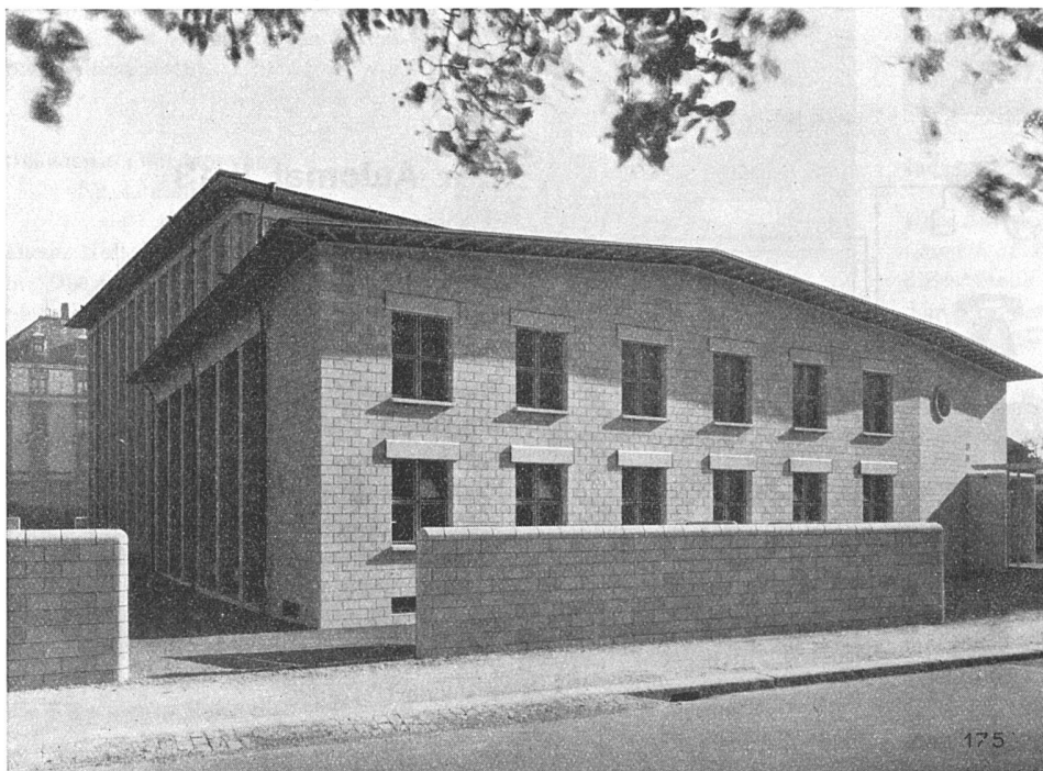
First Church of Christ Scientist, Zürich

Fassadenverkleidungen in mehrfarbigem, künstlichem Muschelkalk wirken vornehm und ruhig. Gediegenes Farbenspiel. Äußerst widerstandsfähig gegen alle Witterungseinflüsse.