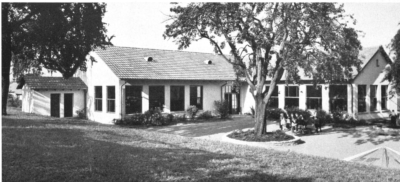
Abb. 47 Gesamtansicht mit Spielhof | Vue générale du sud-ouest | General view with play court