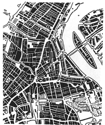
Plan von Rotterdam vor der Bombardierung