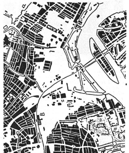
Plan von Rotterdam nach der Bombardierung von 1940. Der vom Stadtplanbüro ausgearbeitete Wiederaufbauplan, anfänglich stark axial und unfunktionell entwickelt, liegt heute in wesentlich organischer Fassung vor

Wohnbau «Plaslaan» 1937/38, von den Architekten W. van Tijen & H. A. Maaskant. 10 Geschosse mit Kleinwohnungen. Der Bau hat sich sehr bewährt. Noch während des Krieges bearbeiteten die Architekten u. a. drei äußerst interessante Projekte, die nun zur Ausführung gelangen: ein großes Wohnquartier, einen fünfgeschossigen Kleingewerbeblock für 1500 Arbeiter und Angestellte mit gemeinsamen Büros, Empfangsräumen, Restaurant und ein Wohnhochhaus mit 12 Geschossen