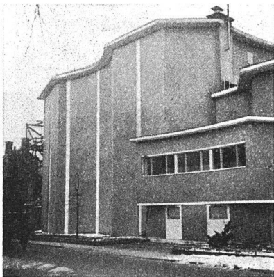
Erweiterungsbau des Radiostudios AVRO 1940, von Architekten Merkelbach & Karsten, und A. Bodon. Die Raumform des großen Konzertsalles entspricht neuesten akustischen Studien