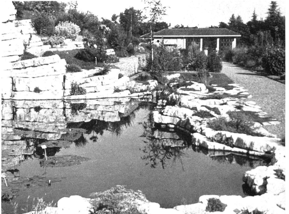
L'étang avec vue sur le pavillon