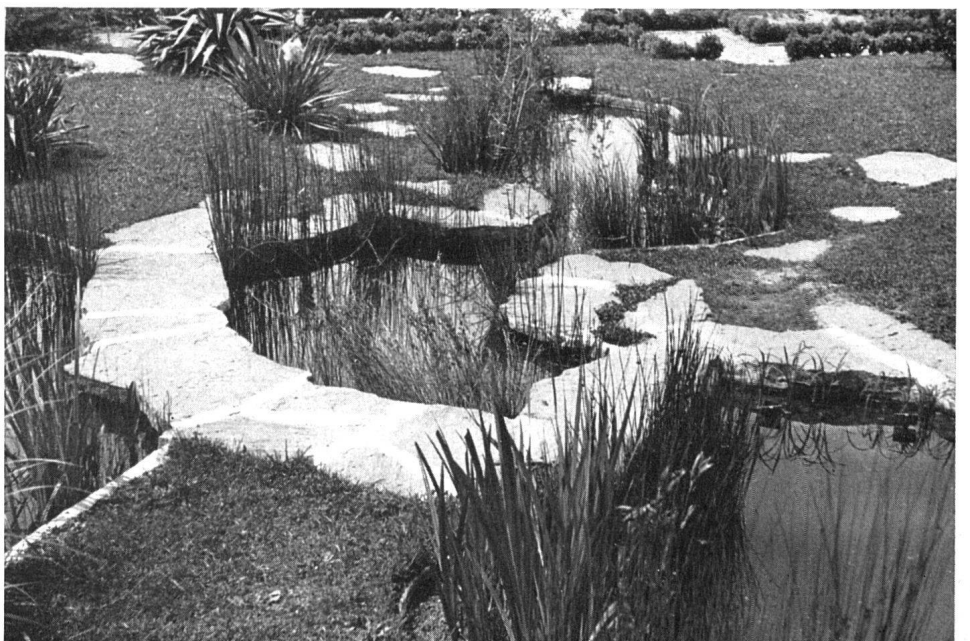
Petit étang pour plantes aquatiques