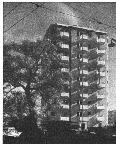
Schwedisches Wohnhochhaus («Punkthaus») in Stockholm. Architekten: Sven Backström und Leif Reinis. Aus «The Architects' Journal» (London), 15. August 1946

Studi . Mailand. Gegründet und redigiert von einer Gruppe der Associazione Libera Studenti Architetti. Verantwortlicher Redaktor: Arturo Morrelli. (neu)