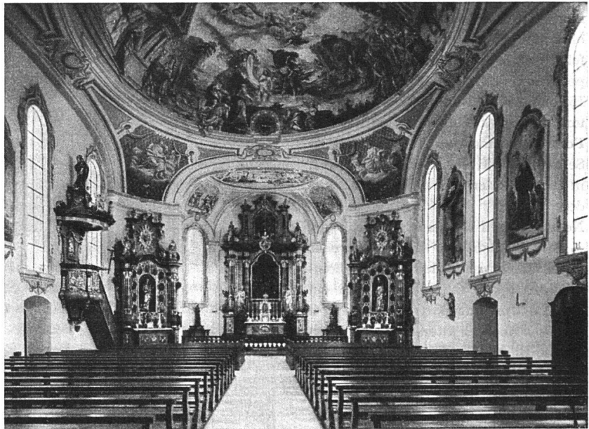
Nach der Renovation von 1942